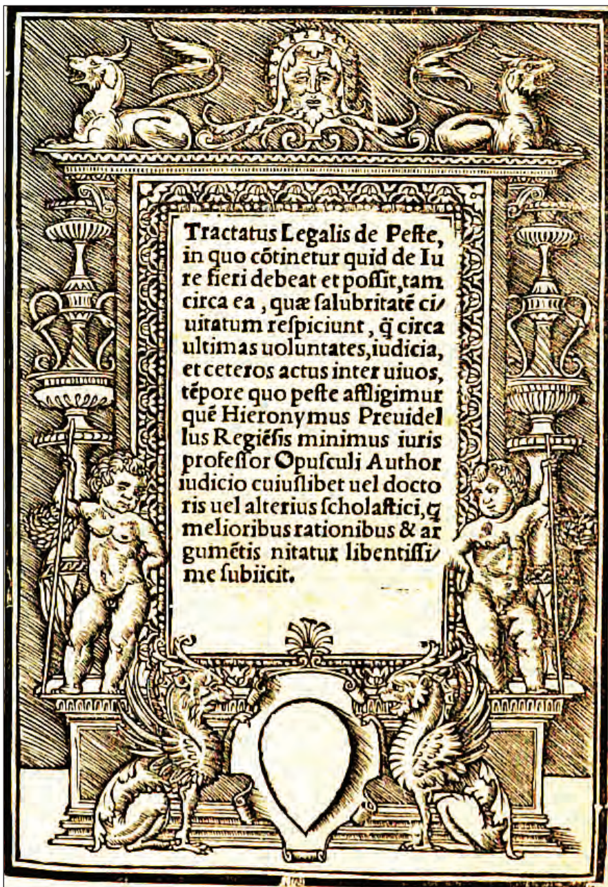
Slika 2: Girolamo Previdelli: Tractatus legalis de peste (1524).