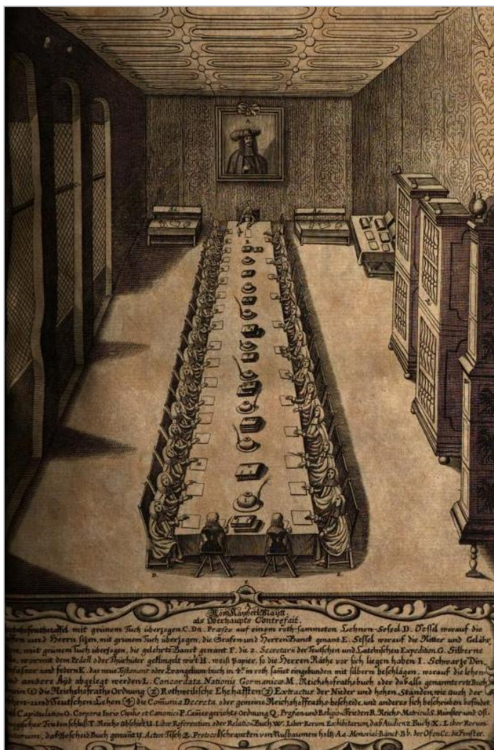
Zasedanje cesarskega dvornega sveta ( Reichshofrat ) na Dunaju (Ioannes Christoph Uffenbach, Tractatus singularis et methodicus de excellentissimo consilio caesareo-imperiali aulico (Viennae, 1683), str. 240)

Constitutio Criminalis Theresiana (1769) je možnost sodnikove konzultacije pravnih strokovnjakov v kazenskih zadevah omejil na posvetovanje med sodišči višje in nižje stopnje.