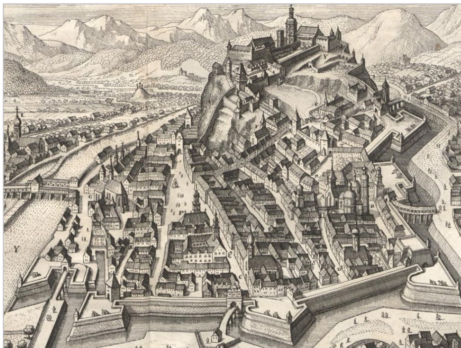
Gradec v 17. stoletju. S črko P je označena mestna hiša, desno od nje dvorec deželnih stanov (črka Q). Martin Zeiller, Topographia Provinciarum Austriacarum (avtor: Matthäus Merian) (Frankfurt am Main, 1679) (Wikimedia Commons)

Banniza še v 18. stoletju poroča o spodnjeavstrijskem sodnem običaju, po katerem je upravitelj deželnega sodišča ("Landgerichtsverwalter") po zaključenem preiskovalnem postopku na nižjih sodiščih spise v najtežjih kazenskih zadevah poslal nadrejeni (višji) gosposki. Ta je pritegnila do šest učenih pravnikov, ki so pregledali spise in izdelali osnutek vmesne (interlokuta) ali končne sodbe, to pa poslali v podpis predsedniku deželnega sodišča. 159 V teh primerih govori Banniza celo o nujnem pošiljanju spisov ( transmissio actorum necessitatis ), saj je šlo za primere, kjer sodnih zmot ne bi bilo mogoče sanirati. Fakultativni transmissio actorum pa je bil predviden za zadeve, kjer ni šlo "za vrat", denimo, ko je sodnik odločal o prostostni kazni. 160 Banniza v svojem poročilu (dunajske) fakultete ne omenja.